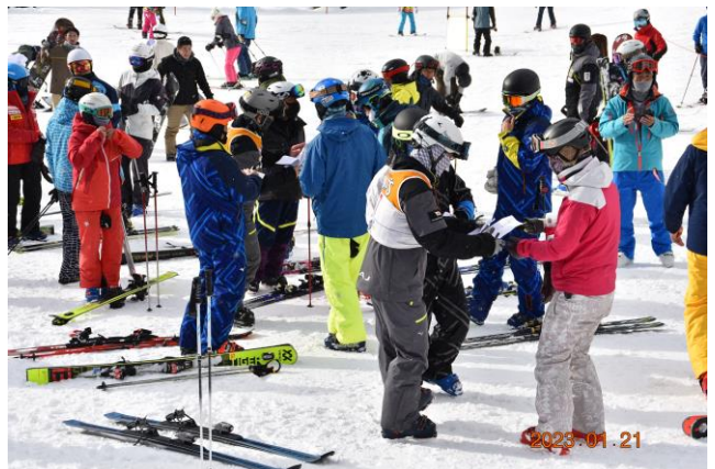
まずは体調チェックシートの提出