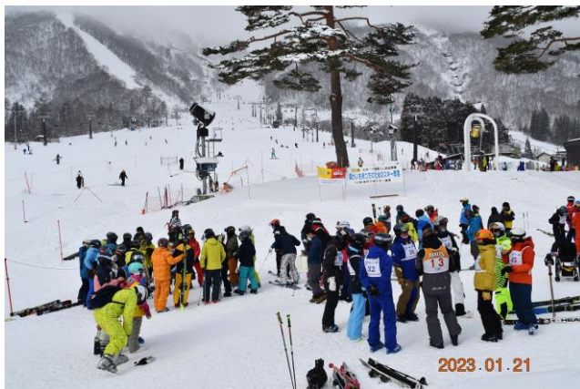
各班ごとに集合、受付