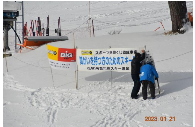
朝早くから看板を設置し準備するハンディキャップ委員